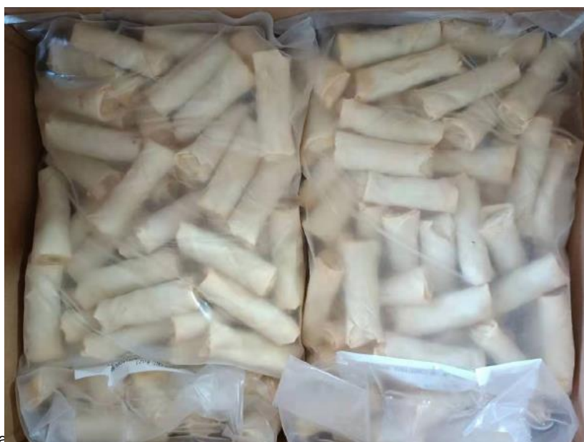
Imagen del producto estándar.