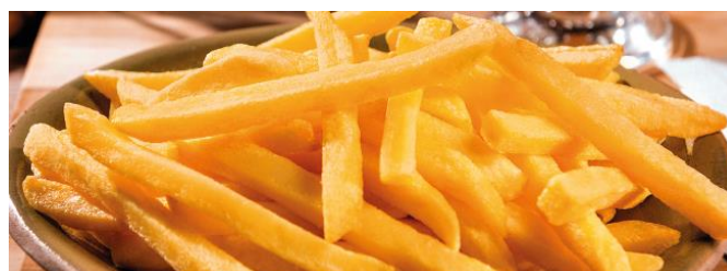
Imagen del producto.