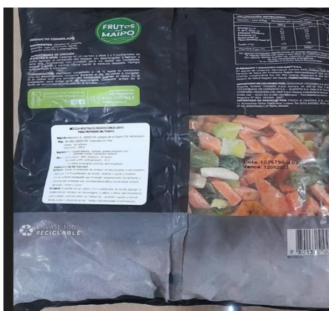
(Imagen referencia ubicación etiqueta )

La etiqueta debe ir pegada la parte posterior del envase de tal forma que no tape ningún tipo de información legal, ni fecha ni lote.