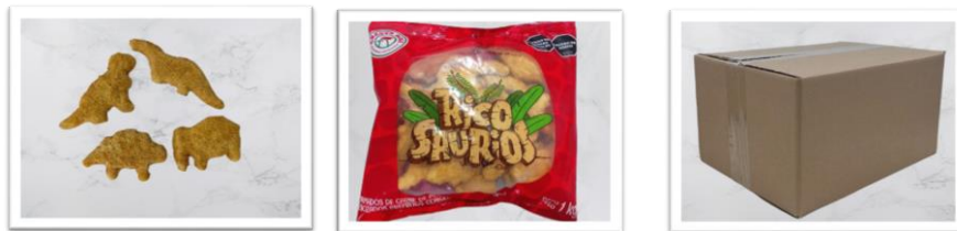
The image is for illustrative purposes / La imagen es a modo ilustrativo